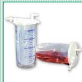
Saco descartável para secreções MONOKIT

*)É necessário mencioná-lo no ato da compra. Por conseguinte somente o fabricante pode instalá-lo.