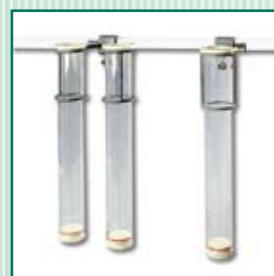
Depósito para armazenamento de cateteres e porta depósito simples, duplo