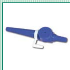
Válvula de segurança – aumenta consideravelmente o conforto na hora de aspirar