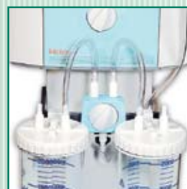
Computador de coletor de frasco cheio