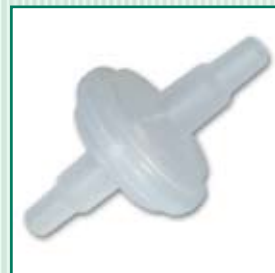
Filtro de aspiração (embalagem para 20 itens)