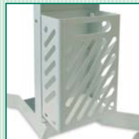
Cesta para armazenamento