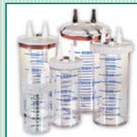
Frasco coletor (garrafa) 0,5; 1; 2 e 4 l de policarbonato, para uso frequente de polissulfonato